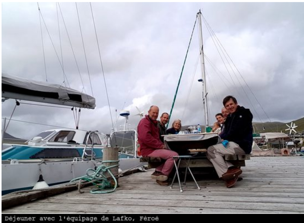
Déjeuner avec l'équipage de Lafko, Féroé

L'après-midi, nous allons nous promener près d'une rivière, au milieu des moutons et des oies. Nous aimerions passer plus de temps dans ces îles, mais le mois de septembre approche très vite. Nous devons continuer à descendre plus au sud. Lafko aussi, qui s'en va dans la nuit pour l'Ecosse. Et puis, notre seconde liseuse a rendu l'âme. Je n'ai plus rien à lire, il devient urgent de rentrer !